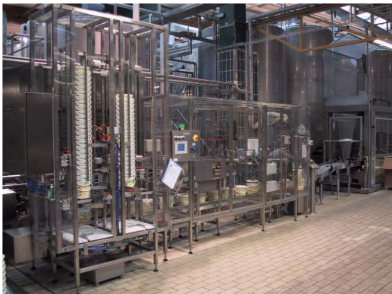
3000-serien Helautomatisk hinkfyllningslinje med helautomatiska formatbyten (AFC system)