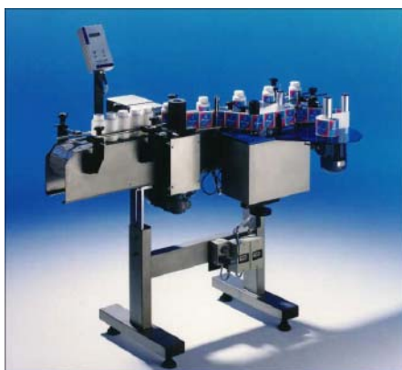
Etikettmaskin med 3-valssystem för stabil och säker etikettering runt-om på flaskor & burkar