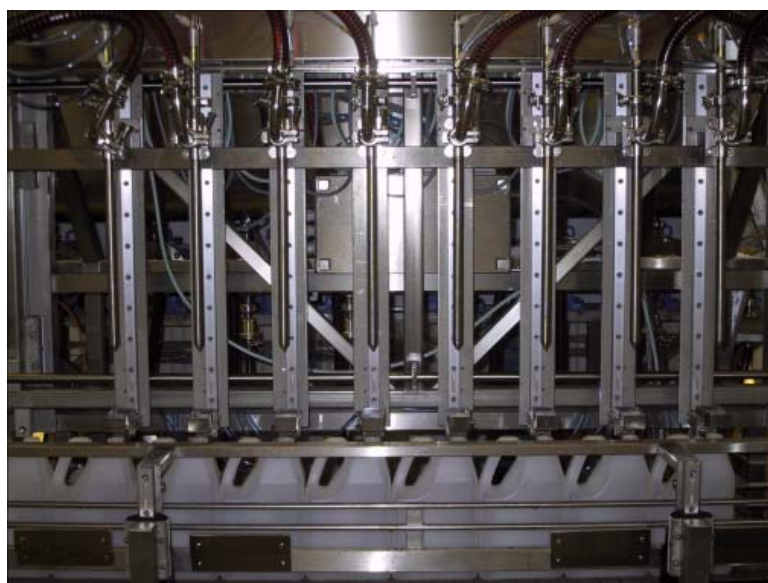
Exempel på maskin med 8 st fyllningshuvuden, ställs in automatiskt!

Oavsett om maskinen förses med 1 fyllningsmunstycke eller fler, behövs endast en knapptryckning på operatörspanelen för att ställa in hela maskinen med mycket hög precision utan att specialist-kompetens eller verkstadsresurser behöver tas i anspråk. Nästa fyllning med nya fyllningsparametrar kan omedelbart köras igång med helt andra förutsättningar. Rationellare, snabbare, exaktare och enklare kan det knappast bli. Driftsäkerheten och maskintillgängligheten kan radikalt förbättras.