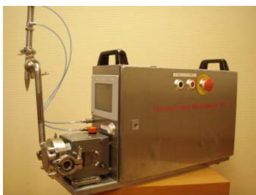
SP2201 volymfyllningsmaskin med 1 st vingrotorpump försedd med ett pneumatiskt fyllningsmunstycke